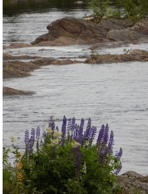
Lupine en moerasspirea

Dus meld je gerust als je een liefhebber bent!