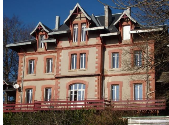
Het prachtige huis Jacournassy

De huidige eigenaren hebben alle ramen en kozijnen vervangen en er een nieuw verwarmingssysteem ingezet en ook in de winter is het aangenaam toeven. Met 11 slaapkamers, twee woonkamers etc. is er iets heel moois van te maken. Het totale terrein omvat 19 hectare grond met bospartijen en landerijen voor paarden, schapen o.i.d..