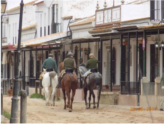
De dorpelingen rijden trots op hun Andalusiërs van de ene bar naar de andere...

Het dorp brengt je terug in de tijd: zandwegen en saloons. De dorpelingen rijden trots op hun Andalusiërs van de ene bar naar de andere, worden op hun paard bediend en kunnen hun glaasjes op de hoge togen plaatsen.