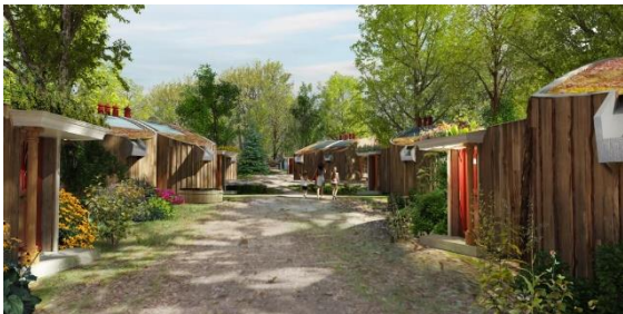
Ecodorp - ontwerp: Peter Blok

Ter illustratie van het uitgewerkte project heb ik weer een foto van Peter Blok, de architect, toegevoegd.