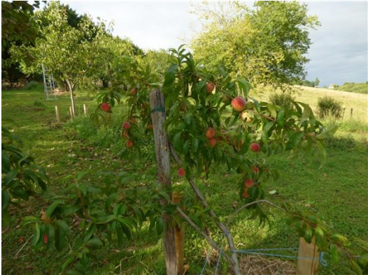
Een evenwichtig boompje met minder perziken...