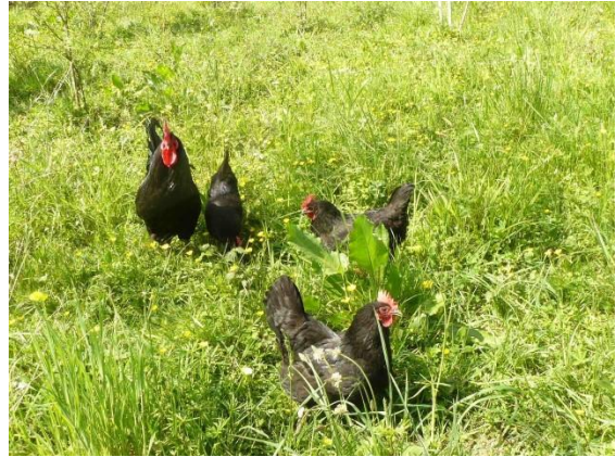
Poules de Gascogne 2015 in de boomgaard

in juli verorberd door een groep verwilderde honden.