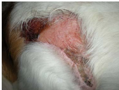
Vrijdag 4 mei 2012