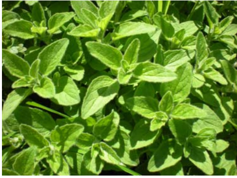
Jonge wilde marjolein (oregano)