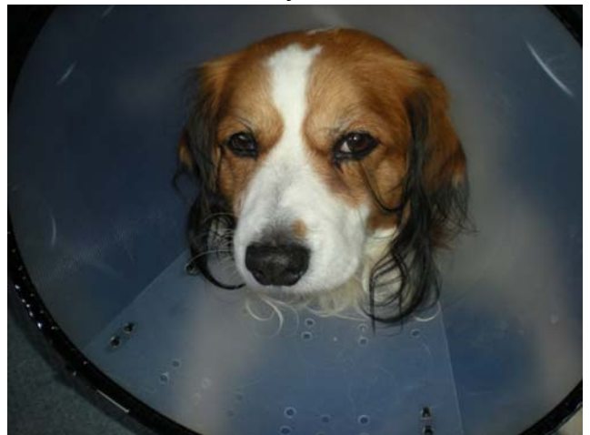
Zaterdag 3 december 2011

Het werd januari, februari ogenschijnlijk ging alles goed. Totdat er een moment kwam dat de droefheid weer toesloeg, ergens in maart begon dat depri gevoel weer, ik zat niet lekker in mijn vel en half april heb ik toch in het weekend nog twee flinke wandelingen gemaakt. Mijn vrouwtje met haar vriendin gingen met mij gingen wandelen. We liepen een flink stuk en ik vermaakte mij opperbest.