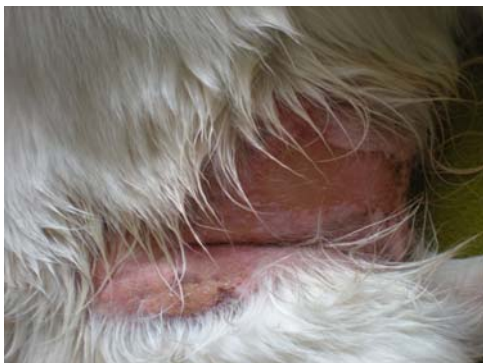
Vrijdag 27 april 2012

http://www.visionair.nl/ideeen/mensheid/cellen-communiceren-met-biofotonen/