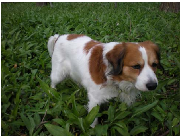
Zondag 15 april 2012

Mijn vrouwtje viel jaren geleden op mijn ras, zo lief om te zien en die mooie lange oren met zwarte pluimen. Ik geef toe: als ik leuk kijk ben ik aller-charmantst.