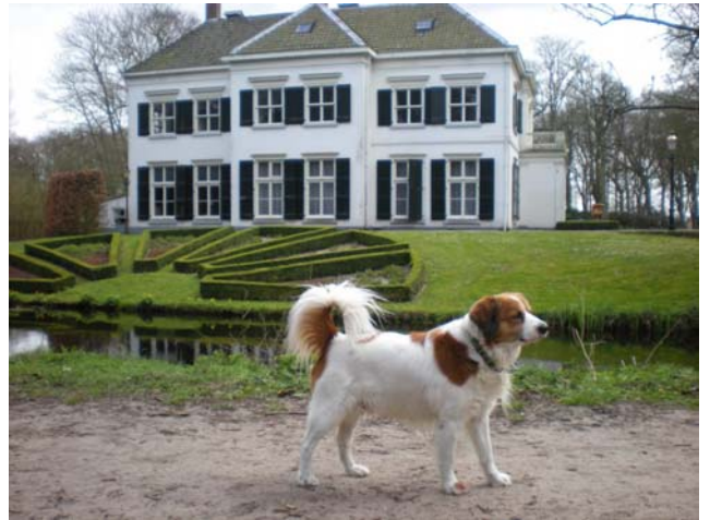
Zondag 15 april 2012

Je kunt mij in de rij zetten met een Friese Stabij en een Drentse Partrijs. Ik ben dus een jachthond en in het verleden gingen kooikerhonden mee met de Kooiker om de eenden op te drijven.