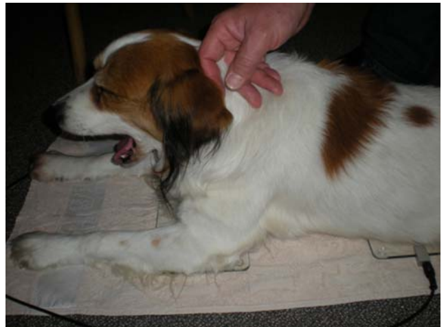
Dinsdag 8 mei 2012

Wisten jullie dat elders op de wereld katten en honden in hun staart of poten gevaccineerd worden?