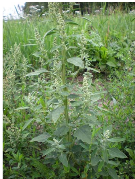
Melganzenvoet in de zomer