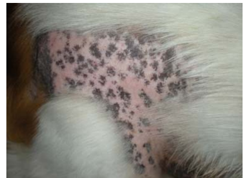
Dinsdag 22 mei 2012

Op de volgende bladzijde, bladzijde 8, vind je de Natuurlijke tips