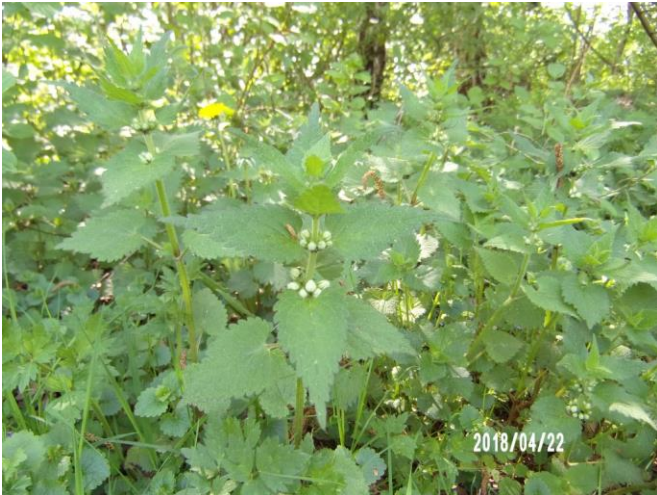
Witte dovenetel en brandnetel groeien vaak samen

Onderweg zien we ondergelopen weilanden, want overal in Europa is het extreem slecht weer geweest. Eenmaal aangekomen op de camping in Nederland, zien we blaadjes heel pril aan de bomen. De appelboom heeft voorzichtig haar bloesem klaarstaan en die zien we in de week die erop volgt prachtig opengaan en tot volle bloei komen.