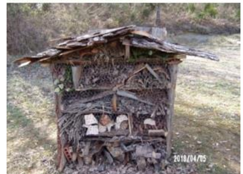
Het eindresultaat mag er zijn!