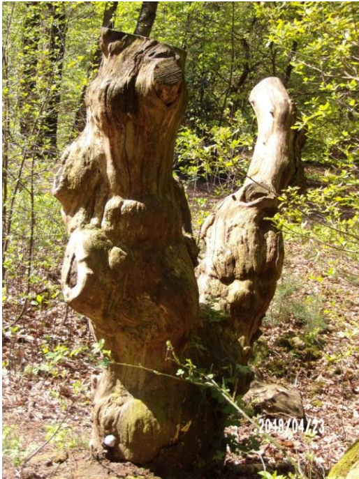
Een natuurlijk beeld in het bos