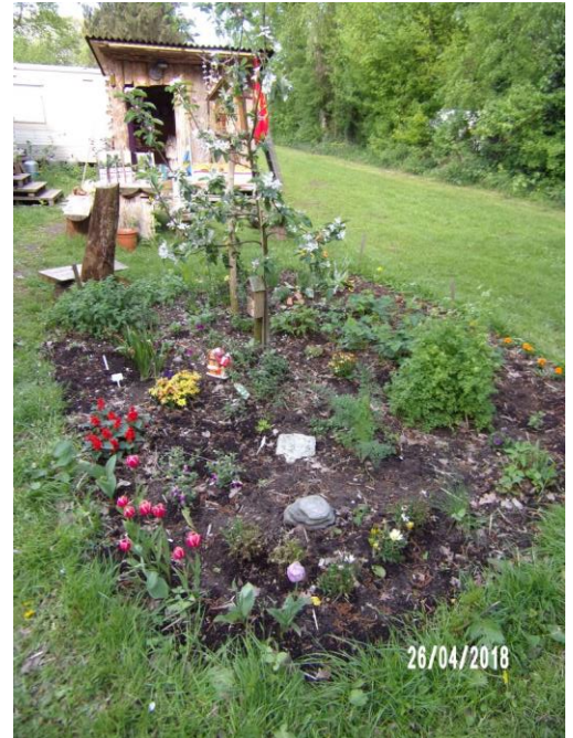
de tuin met afgedankte, maar nog levendige plantjes

Je kunt de hooimadam ook gebruiken om thee te laten trekken, zonder dat deze afkoelt.