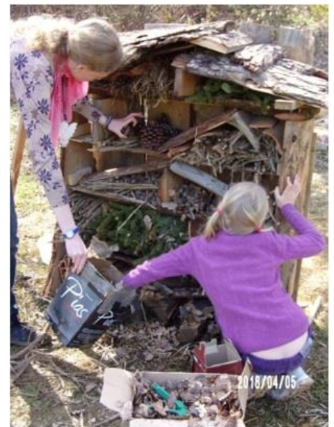
Het insectenhotel in aanbouw