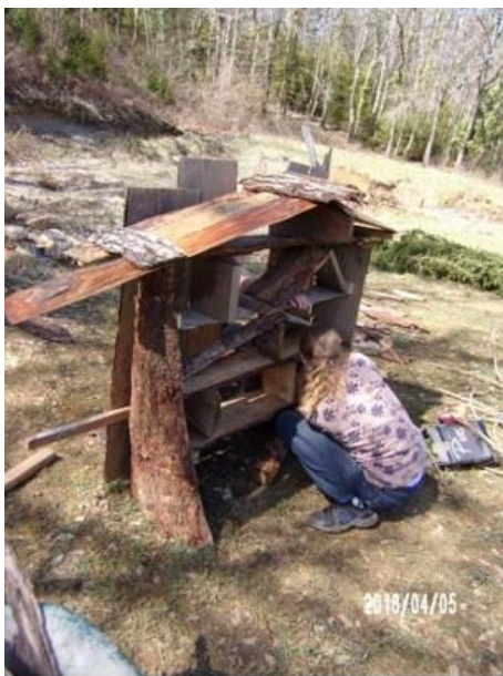
Het insectenhotel in aanbouw

Ze heeft nog veel meer plannen, maar vergeet steeds haar bood-