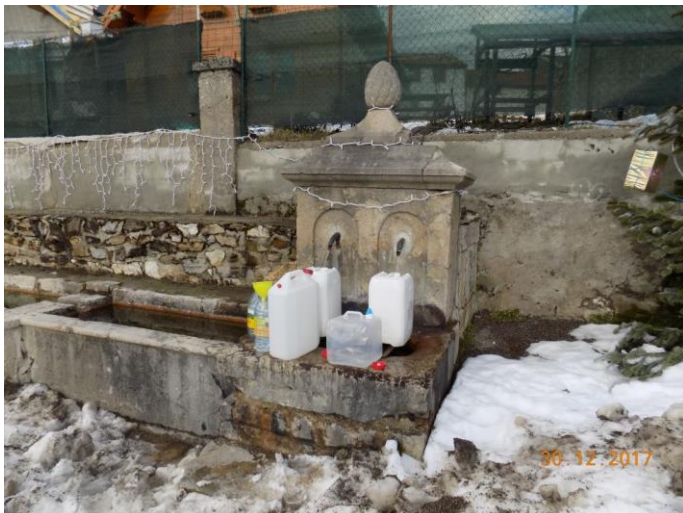
Water halen bij de bron voor alle bewoners van L'Assaladou

Er ligt al een flink pak sneeuw hier en de ijskoude lucht overviel ons wel een beetje.