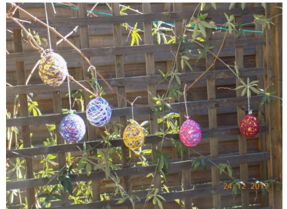
Lampjes, geknutseld met wol en lijm, om ballonnen gewikkeld.