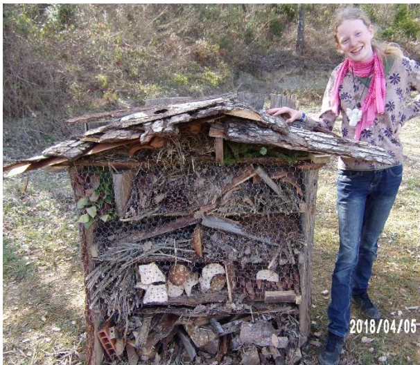
De bouwmeester bij het eindresultaat...

Als laatste bevestig je het kippengaas voor het insectenhotel, om te voorkomen dat al je vulmateriaal er weer uitvalt. Dit kun je het beste met een houtnietmachine doen. Vergeet niet om af en toe te kijken of er al insecten in je hotel zijn gaan wonen!